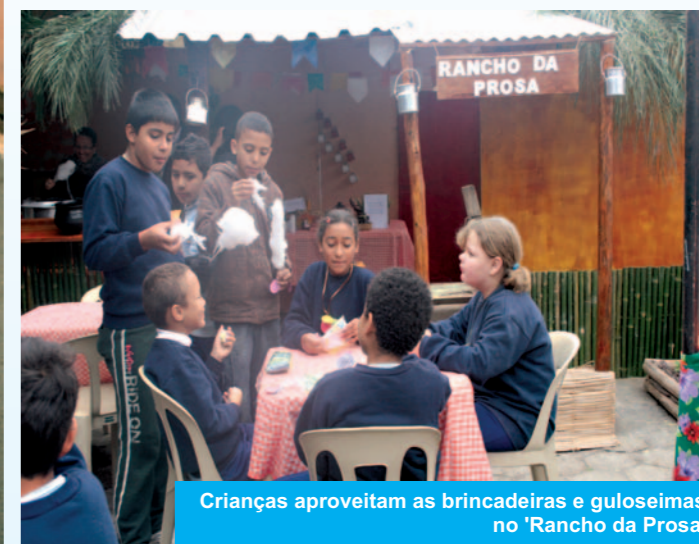
Crianças aproveitam as brincadeiras e guloseimas no 'Rancho da Prosa'