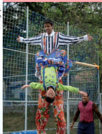
Alunos fazem espetáculo circense durante a Semana

A Unidade Eugênio de Melo serviu de palco, entre os dias 13 e 17 de junho, para a "Semana de Acesso à Cultura", um evento destinado a trazer os bairros do entorno da Unidade, como Galo Branco, Jd. Itapuã, Righi e outros para assistir diversas manifestações artísticas e culturais.