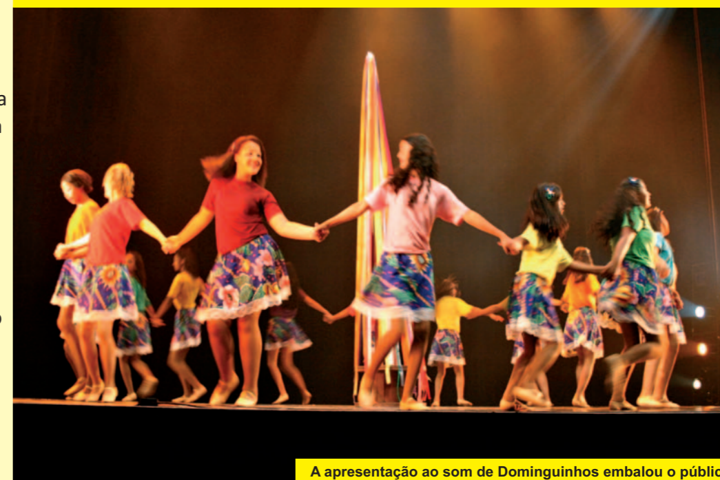
A apresentação ao som de Dominginhos embalou o público

Após cinco meses de ensaios, dezesseis alunas da Unidade Fundhas Petrobras se apresentaram na 22ª edição do Festidança com a coreografia de dança popular “Dia de Festa”. As adolescentes que dançaram ao som de “Isso aqui tá bom demais” de Dominginhos, têm entre 12 e 13 anos e animaram o público com um espetáculo baseado na dança de fitas, típica no Nordeste. O Grupo de Dança Fundhas Petrobras foi uma das duzentas e oitenta e oito equipes pré-selecionadas para participar do Festidança 2011, que teve setecentas e noventa e nove inscrições vindas de sete estados brasileiros.